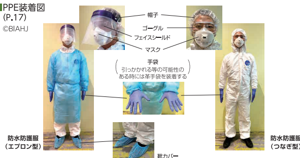
■PPE装着図 (P.17)

病院内の措置としては、来院した動物のSFTS感染が疑われた時点で、症例に触れるスタッフ全員が個人防護具 (PPE) を装着し、院内を70%アルコールや0.5%次亜塩素酸ナトリウム液で消毒 (診察台や処置台、入院ケージ、タオル類、トイレなど) することが推奨されます。また、SFTS感染動物が死亡した場合の死体の取り扱いにも十分注意が必要 (ペットシーツなどで包み、さらにビニール袋で3重に包む簡易棺桶等の箱に入れ、さらにビニール袋で覆い消毒液を掛ける、など) です。死体の取り扱いに関して不明な点は、各自治体に問い合わせ確認したほうが良いでしょう。